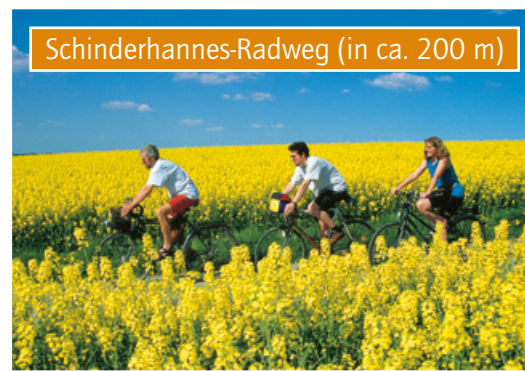
Schinderhannes-Radweg (in ca. 200 m)