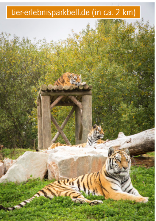
tier-erlebnisparkbell.de (in ca. 2 km)