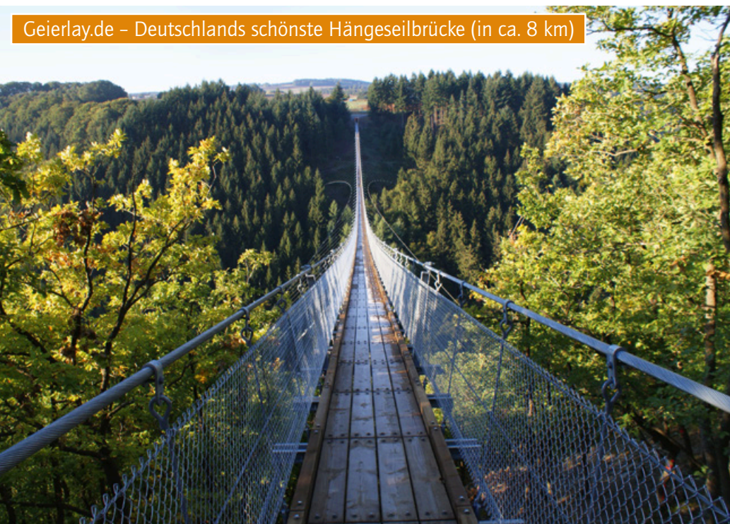
Geierlay.de – Deutschlands schönste Hängeseilbrücke (in ca. 8 km)