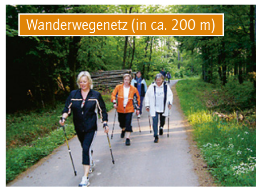
Wanderwegenetz (in ca. 200 m)