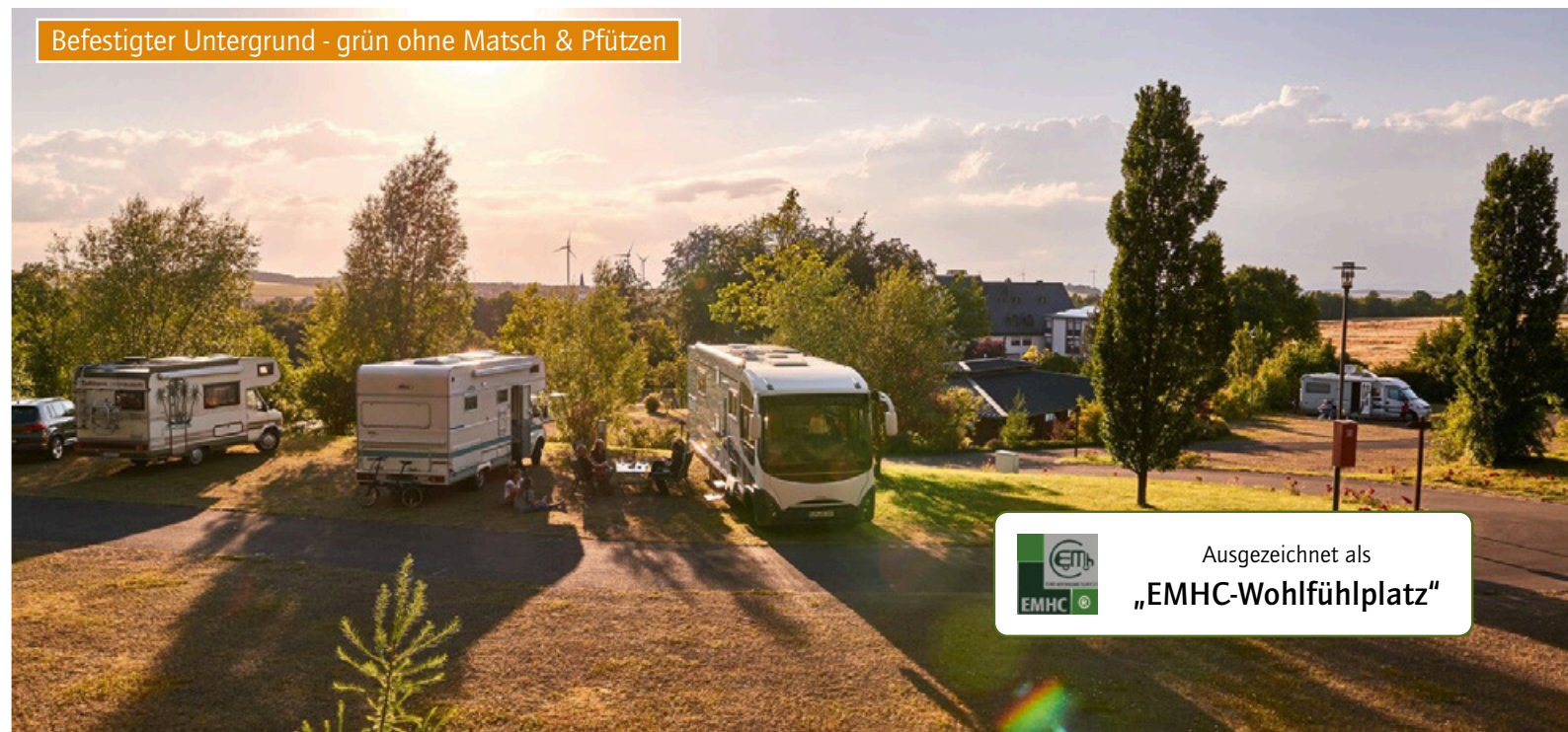
Befestigter Untergrund - grün ohne Matsch & Pfützen