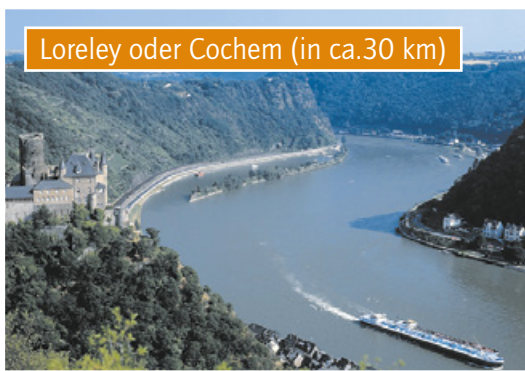
Loreley oder Cochem (in ca.30 km)