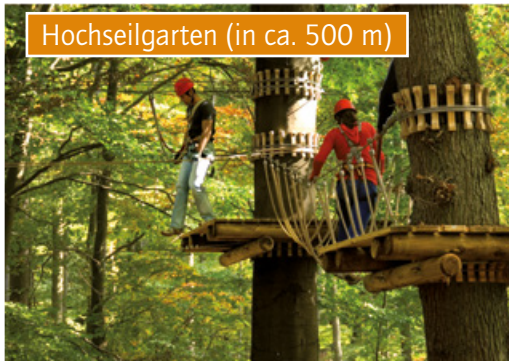
Hochseilgarten (in ca. 500 m)